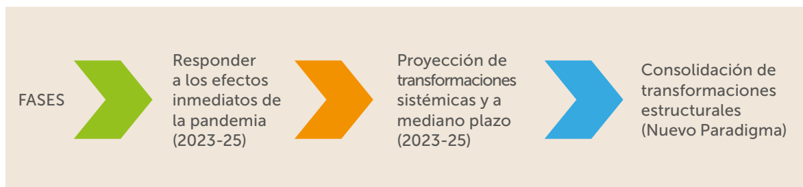
Figura 1. Fases de la Política de Reactivación Educativa Integral